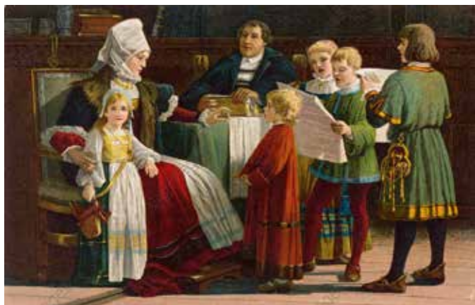
Luther giftede sig med en nonne, Katharian von Bora, og grundlagde dermed den protestantiske præstegårdskultur.