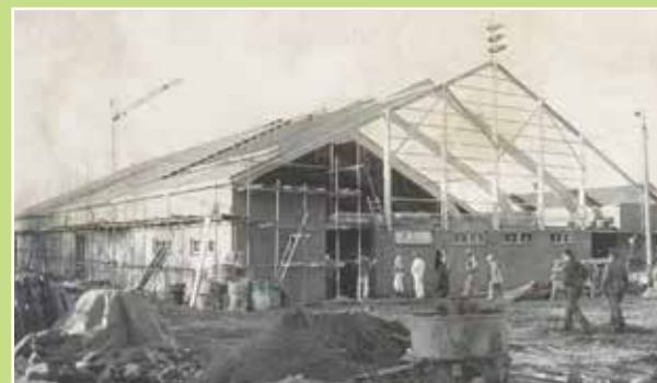
Rejsegilde på hallen i 1976

- og blev bygget af den daværende Rudbjerg kommune som fælles idrætsanlæg. Udover masser af sport fra gymnastik og volleyball, håndbold og badminton, har hallen også givet plads til folkedans, modeopvisning, loka-larkiv, fritidsmesse, familiefræs og koncerter.