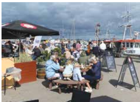
Mange mennesker på havnen til sidste års fjorddag

Det foregår i det store telt ved havnen.