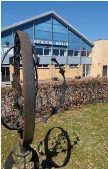
Det nye kulturcenter i Rudbjerg?

Den økonomiske håndsrækning gør det muligt at skabe endnu mere liv, leg og bevægelse i lokalområdet!