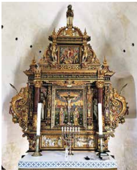
Den vidunderskønne altartavle i Tillitze