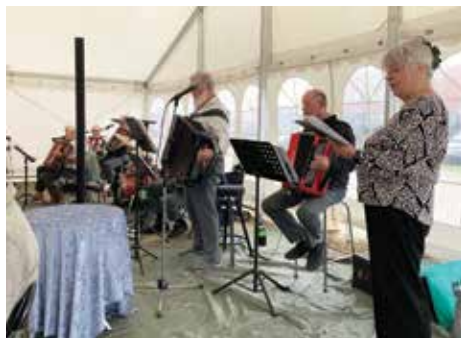
Rødby Spillemandene spiller