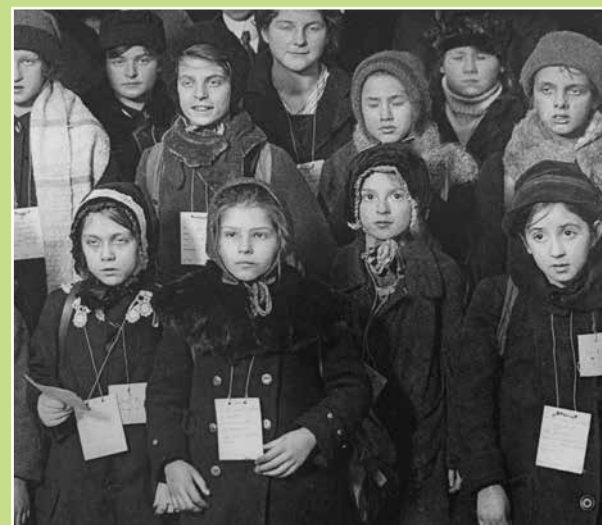
Wienerbørn med seddel om halsen

Der kom wienerbørn både efter Første og Anden Verdenskrig.