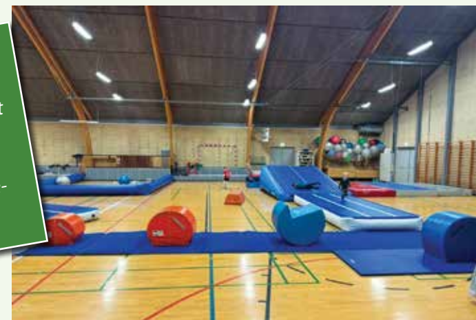
Familiefræs i Rudbjerghallen

En kæmpe tak skal lyde til Nordea-fonden for at støtte op om vores lokalsamfund og gøre disse drømme til virkelighed.