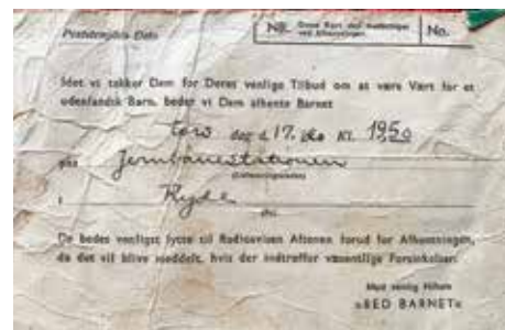
Sedlen som hang om den østrigske piges hals på Ryde station

Det var Red Barnet som formidlede kontakten mellem børn fra Østrig og danske plejefamilier, som kunne have et ferieborn boende.